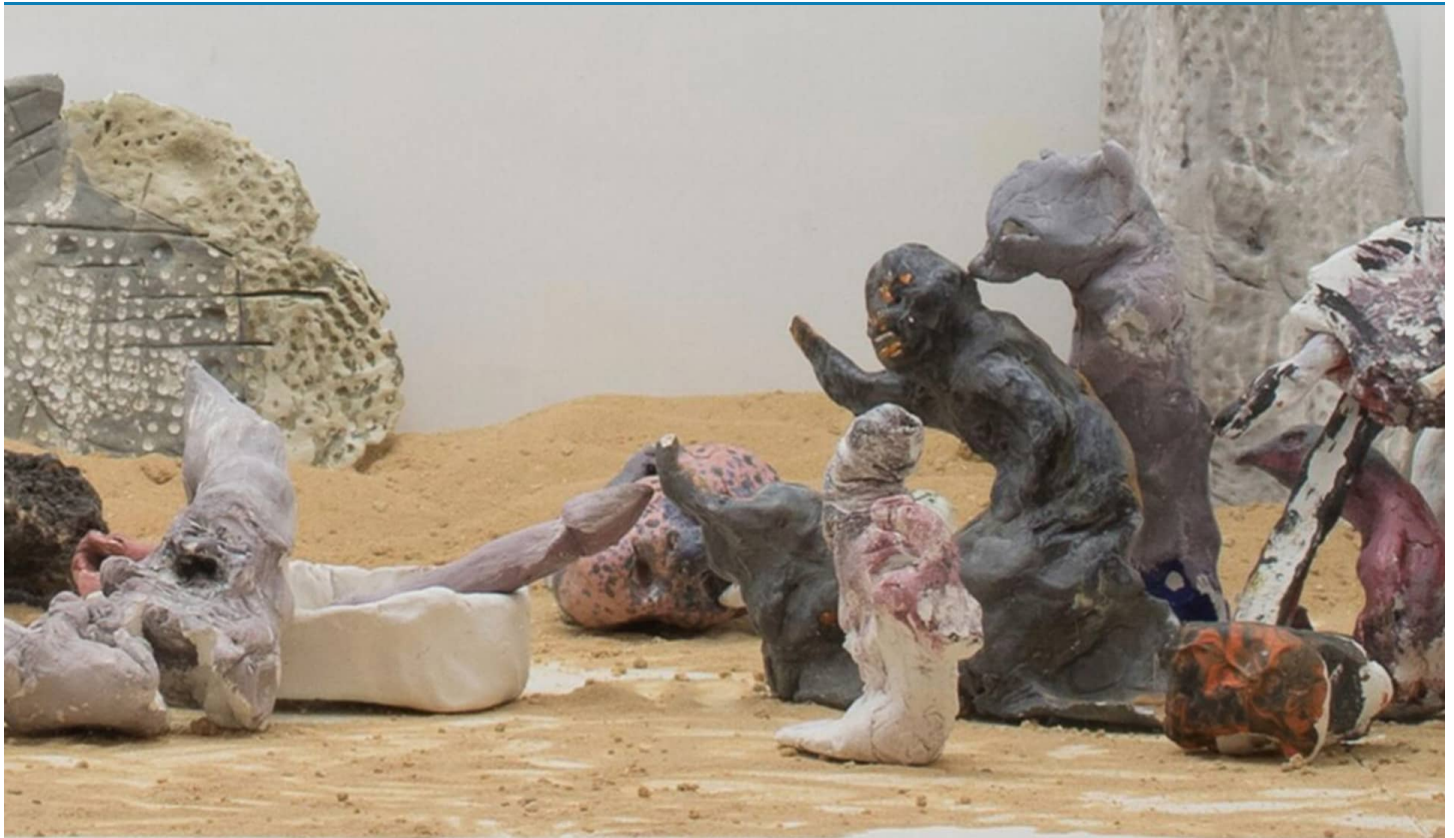
אבנר בן־גל ב-Würfel TLV. תערוכה שמציבה את האמנות כנסות