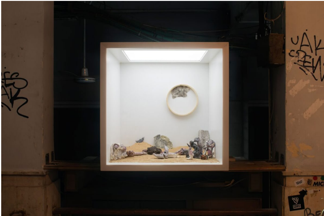
קופסת האור

ממשי וחומרי שיש לבוא אליו (שלא כמו הרשת). היא מעמידה קובייה לבנה, כפשוטה - קובייה שהיא היצירה ולא חלל התצוגה, אבל גם יצירה ללא חלל שעוטף אותה. במובן זה, מדובר במהלך כפול, קלאסי ובן זמננו.