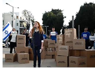
הארץ / הדבר הבא, שמולי ושפיר: חמלה ליהודים בלבד