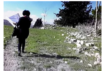
הארץ / לצאצאי הנכבה הזכרונות מסרבים לגווע