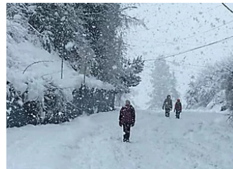
הארץ / אחרי סופת הקור בארה"ב השלג הגיע למקום לא צפוי - הוואי